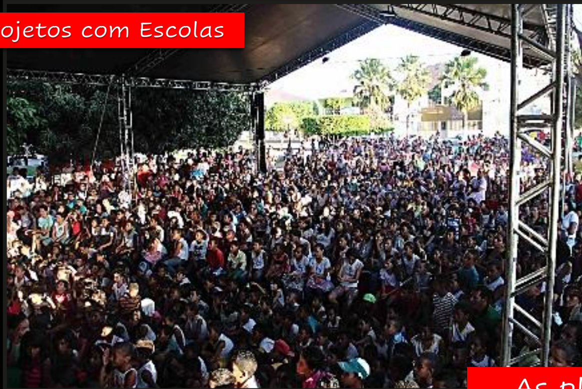
Projetos com Escolas