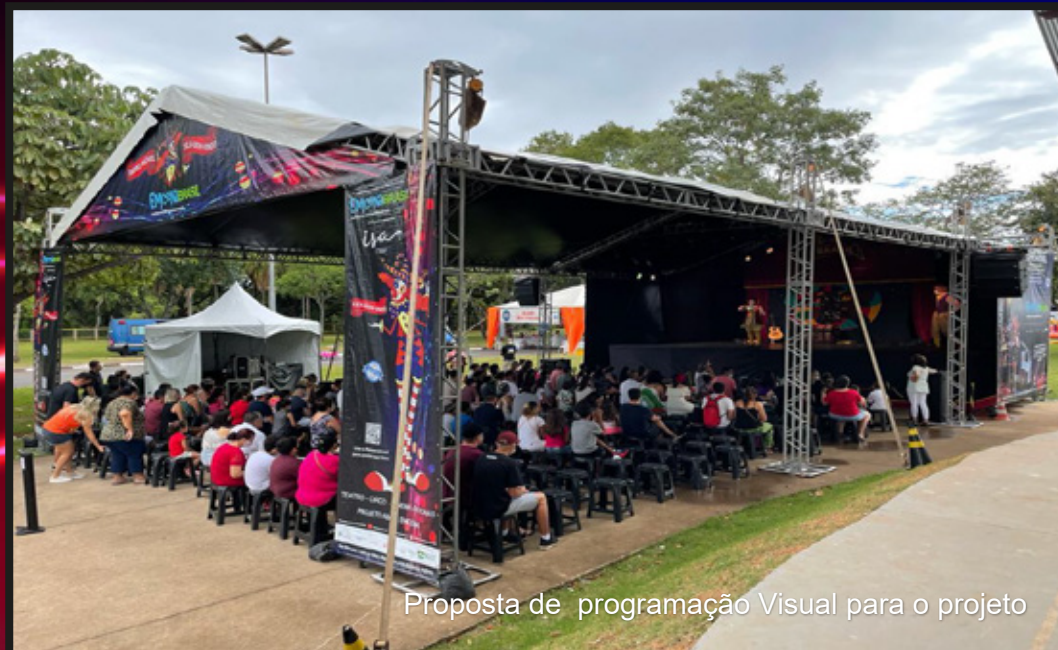
Proposta de programação Visual para o projeto