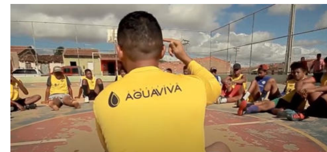
8.000 alunos no esporte. Oferecendo oportunidades e cuidados no contraturno.