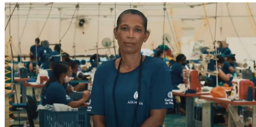
Um linda história de transformação social de uma cidade