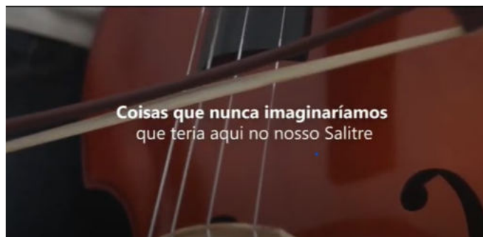
Acreditar é tudo. Projeto social de música no contraturno escolar.